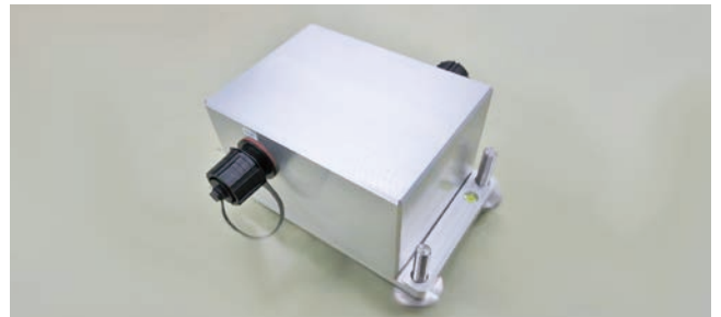
図3 光センサーシステムの3成分センサー格納筐体 （大きさは12 cm × 15 cm × 9 cm）

実観測環境下での耐雷性の検証を行い、良好な結果を得ました。令和2年度は高温対応用のセンサー及び筐体を作成し、令和4年度には新潟工科大の観測井の深さ2000m地点にセンサーを設置し、現在まで連続して高温実証試験を行っております。本課題では今後新たな検証機を製作しその実証試験を繰り返し行うことで、光センサーシステムを「いち早く火山現象を捉える実用的なセンサー」に育て、火山研究および火山防災の高度化に貢献します。