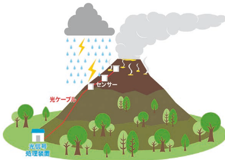
図1 光センサーシステムによる火山観測概念図

実観測環境下での耐雷性の検証を行い、良好な結果を得ました。令和2年度は高温対応用のセンサー及び筐体を作成し、令和4年度には新潟工科大の観測井の深さ2000m地点にセンサーを設置し、現在まで連続して高温実証試験を行っております。本課題では今後新たな検証機を製作しその実証試験を繰り返し行うことで、光センサーシステムを「いち早く火山現象を捉える実用的なセンサー」に育て、火山研究および火山防災の高度化に貢献します。