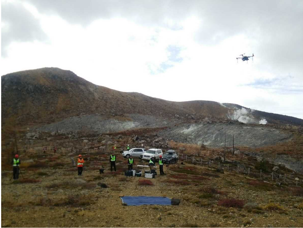
課題 B サブテーマ 4 「火山内部構造・状態把握技術開発」で実施している遠隔熱情報システムの開発の実地試験の様子。ドローンを用いた火山湖水試料採取装置で草津白根山湯釜の湖水を採取できた。